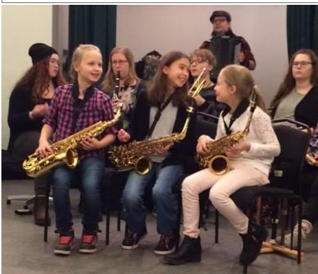
Vinter-TON Delar av blåssektionen