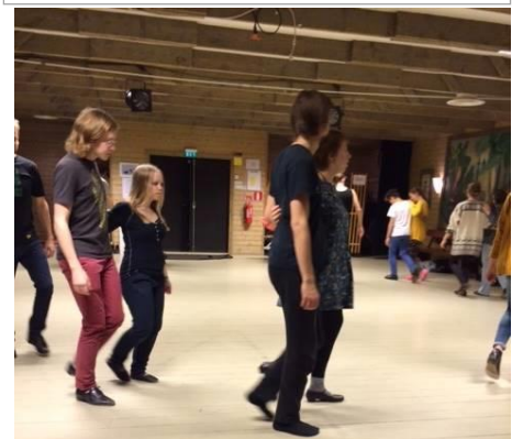
Vinter-TON Dans på Norra Berget