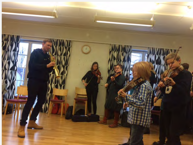
Christian lär ut en låt