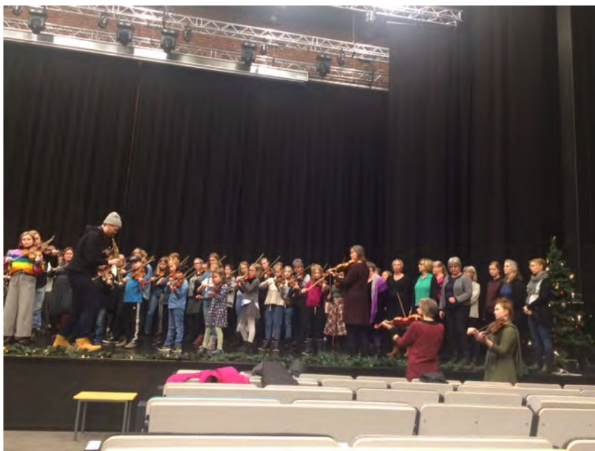
Inför konserten på Vinter-Ton