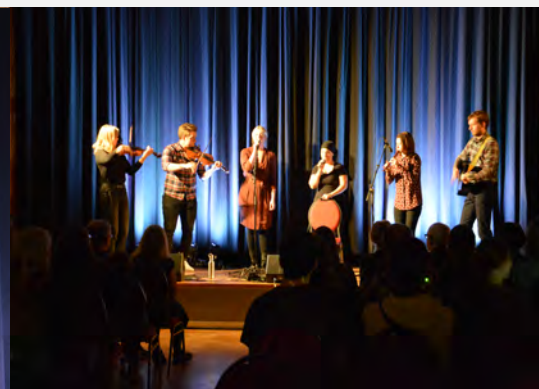
Inför fredagskvällens konsert, värmdes Härnösands Folkhögskolas nystartade folkmusiklinje upp publiken. Gänget kallar sig för "Frilir".

Gässbikullor intog scenen under samspelshelgens första kväll. Tre kullor från Dalarna som visade på stor samspelskonst.